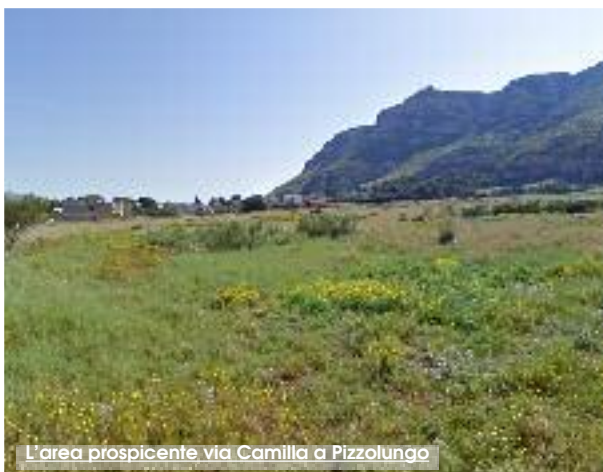
L'area prospiciente via Camilla a Pizzolungo

Si tratta del primo piano di lottizzazione approvato dal consiglio comunale dopo che l'assemblea, e quindi l'Amministrazione ericina, è pervenuta alla determinazione di dotare i piani attuativi della procedura di Valutazione Ambientale Strategica (VAS). Il Piano di Lottizzazione "Tegos Pizzolungo" in realtà, era già stato esaminato in consiglio comunale il 29 Dicembre 2017. In quella seduta il nuovo consiglio sollevò per la prima volta la necessità di dotare i piani urbanistici della procedura VAS. L'orientamento del