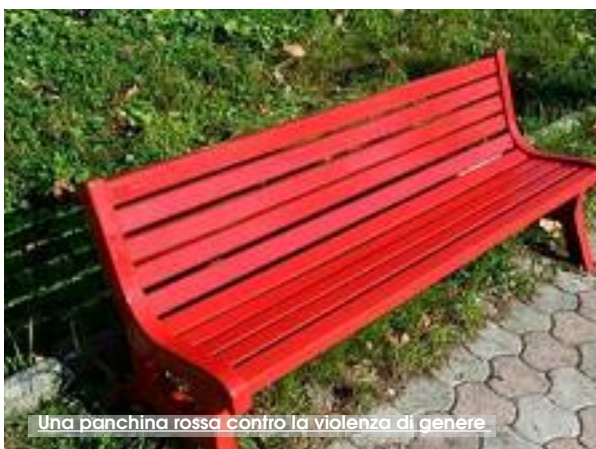
Una panchina rossa contro la violenza di genere

A Custonaci, in piazza municipio, con inizio alle ore 16.30, avrà luogo il progetto "panchina rossa", caratterizzato dalla collocazione di una panchina, simbolo della Giornata Mondiale contro la violenza sulle Donne. Il progetto è un