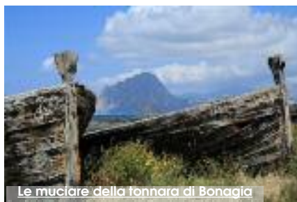
Le muciare della tonnara di Bonagia

Il comune di Valderice ha pubblicato sul sito istituzionale l'avviso di manifestazione di interesse a partecipare al progetto "OLTREMARE Sicilia & Tradizione", cui già partecipa l'associazione "Salviamo le Tonnare". Il progetto Oltremare è una iniziativa di sostegno e sviluppo dei sistemi produttivi regionali varata dalla Regione Siciliana nell'anno in corso. Il comune di Valderice attraverso l'avviso pubblico chiede se vi siano aziende interessate alla partecipazione al progetto. Le istanze delle aziende interessate dovranno pervenire al comune di Valderice entro le ore 13 di martedì 27 novembre allegando il certificato di iscrizione alla Camera di Commercio e la dichiarazione antimafia. Le aziende che saranno selezionate provvederanno successivamente al versamento delle quote di partecipazione. Tutte le